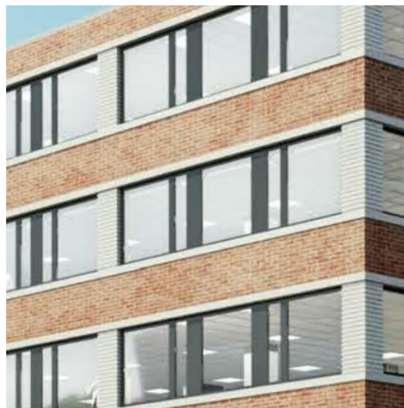
Figur 1 Utsnitt ur visualisering av alternativ 1 förslag utan burspråk. Fönsterband och utformning med tydlig horisontalitet.

Återkoppling efterfrågas efter att fasadgestaltning ytterligare bearbetats. Förslaget är att bearbetad gestaltningen utgår från tidigare inlämnat förslag (alternativ 1) med möjlighet att tillskapa burspråk enligt tidigare synpunkter.